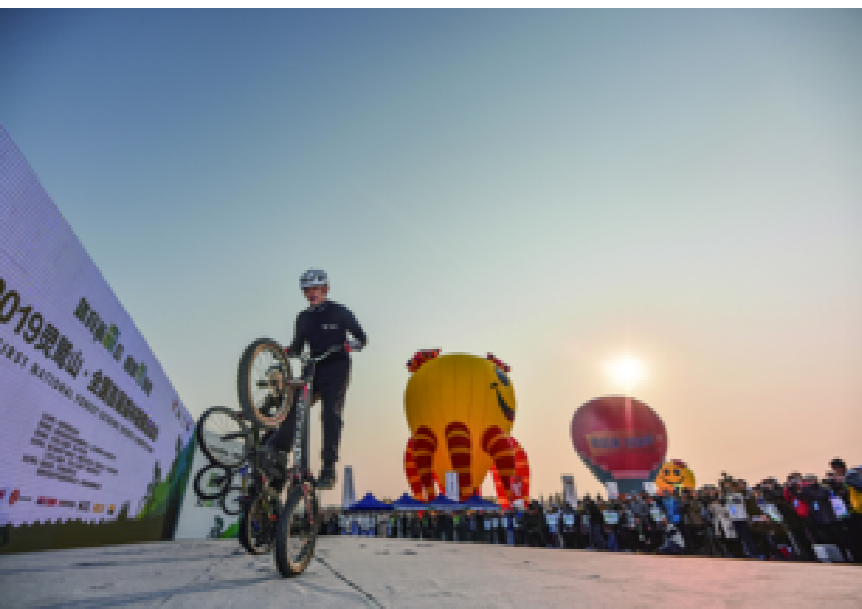
灵鹫山·全国首届森林极限运动会