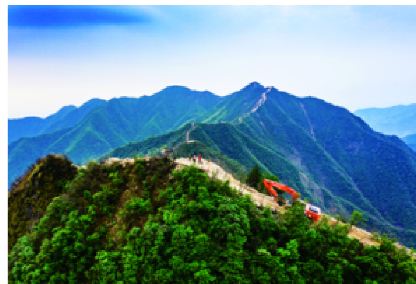
施工中的徐莫岩路

2年内成功创建省级体育现代化县(市、区),3年内把柯城打造成为“全民健身、全民健康”的全民运动示范区,让“运动+”产业成为新的经济增长点。